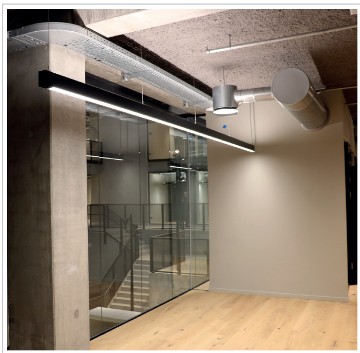
Projektbillede - August Schade Kvarteret